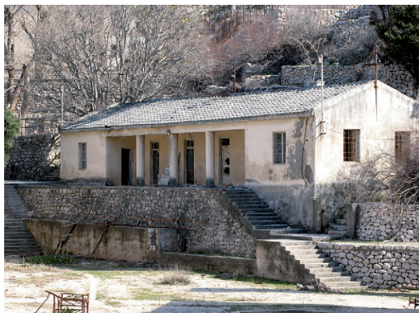
Zgrada centra logorske samouprave

Logor na Golom otoku imao je specifičnu upravnu strukturu. Sama Udba, jugoslavenska tajna policija, gotovo nikada nije bila prisutna unutar samog logora. Ona je ustrojila sustav logorske samouprave gdje su privilegirani logoraši upravljali ostalim kažnjenicima. Ustrojen je i čitav sistem privilegiranja i interne logoraške hijerarhije koji je bio poluga „političkog preodgoja“. Zgrada „Centra“, vrha logoraške samouprave, jedna je od rijetkih autentičnih zgrada u „Žici“. Tu su šefovi logorske samouprave koordinirali zadatke dobivene od Udbe, provodili su u djelo radne planove ili primali logoraše i suradnike. Ovo mjesto bilo je posebno omrzuto među logorskom populacijom. Naime, zatočenici su dobro znali da su podobni logoraši smješteni u „Centru“ produžena ruka Udbe. Rukovodstvo „Centra“ imalo je brojne privilegije o kojima su obični logoraši mogli samo sanjati: krevete, neograničenu hranu i piće, pa čak i alkohol. Nisu morali raditi, ali su naređivali. Inače, slični organizacijski modeli, gdje logoraši upravljaju logorašima u ime uprave, mogli su se naći i u nacističkim logorima, kao i u sovjetskim gulazima.