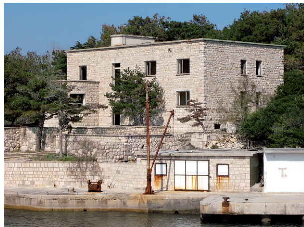
Kamena zgrada

Kamena zgrada je prva zidana građevina na Golom otoku. Izgrađena je 1949. godine radom logoraša za potrebe smještaja uprave logora i isljednika. Nakon završetka izgradnje novog i većeg objekta za smještaj uprave i isljednika 1950. godine (vidi točku 2), kamena zgrada bila je korištena za smještaj čuvara. U kasnijim razdobljima kamena zgrada često je mjenjala funkciju.