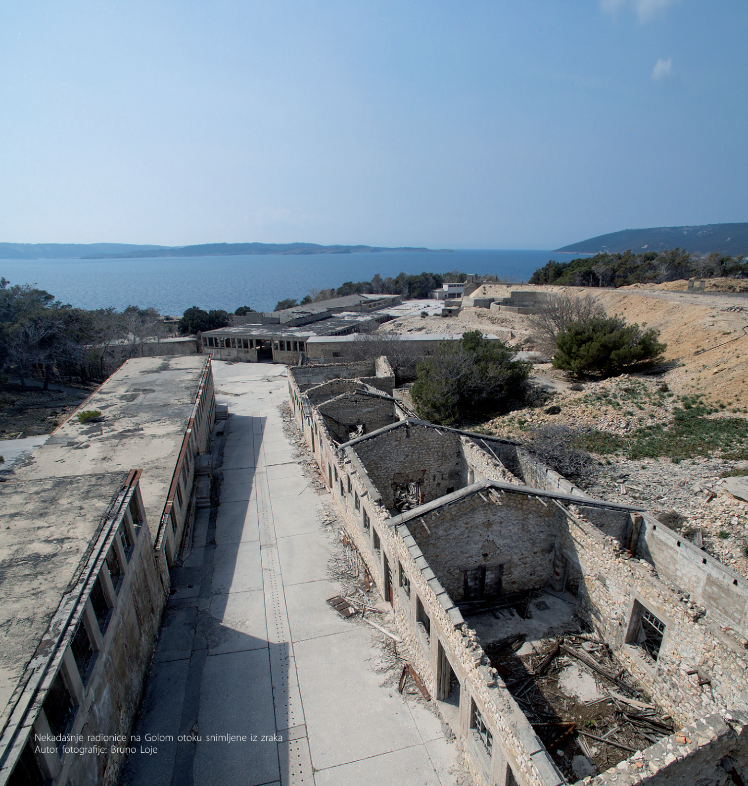
Nekadašnje radionice na Golom otoku snimljene iz zraka