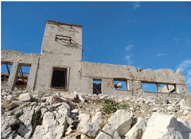
Građevina na Golom otoku 2018.

Činjenica jest da su neki od logoraša na Golom otoku bili vatreni pristaše Staljina što komplicira situaciju s priznavanjem statusa žrtve i onim zatvorenicima koji su na Golom otoku završili samo zato što ih je netko zlonamjerno prokazao kao navodne pristaše Rezolucije Informbiroa. Političke elite komunističke Jugoslavije nastojale su prikriti, odnosno opravdati političku represiju nad oponentima što djelomično objašnjava ambivalentan odnos prema Golom otoku u socijalističkoj Jugoslaviji. Šutnja, proizvoljna konstrukcija opravdanja i blaćenje političkih protivnika legitimacijske su strategije u svakoj diktaturi.