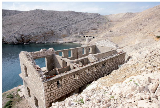
Ostaci ženskog logora na Golom otoku

Nakon toga žene su prebačene u logor na otoku Sveti Grgur gdje su provele oko godinu dana, od travnja 1950. do travnja 1951. godine, da bi potom bile prebačene na Goli otok u logor imena "Radilište 5" (R-V). Tu su provele također godinu dana. Tijekom ovog vremena, iako su bile na otoku zajedno s muškarcima nisu bile u doticaju s njima. Prema svjedočenjima bivših logoroša i logorašica, samo ponekad su jedni druge vidjeli izdaleka. Ženski logor na Golom otoku bio je na posebno nepristupačnom mjestu koje je imalo posebno loše vremenske uvjete jer je bio izložen stalim naletima vjetra. Slično upravnoj strukturi muških logora, isljednice su bile žene, a životni i radni uvjeti bili su teški. Nakon Golog otoka logorašice su prebačene ponovno na susjedni otok Sveti Grgur gdje su dočekale raspuštanje logorskog sustava i izlazak na slobodu.