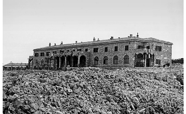
Zgrada tzv. "Hotela"

Tzv. „Hotel“ je zgrada izgrađena tijekom 1950. godine. Služila je kao smještajni objekt za isljednike pripadnike Udbe (1. kat) te prostor za isljeđivanje logoraša i objed (prizemlje). Današnja šuma oko zgrade „Hotela“ rezultat je pošumljivanja od 1950. godine. Naime, uspostavljanje logora promijenilo je Goli otok i njegov okoliš, nije samo utjecalo na logoraše na njemu. Prostor ispred zgrade izvorno je bio kameni krš, kako se vidi na fotografiji. Uprava logora htjela je pošumiti Goli otok ili bar njegove dijelove gdje je to bilo moguće. Zemlja je dovožena s obližnjih otoka te korištena za sadnju drveća, uglavnom borova. Tajna policija i tu je spajala politički preodgoj i prisilni rad. Logoraši su morali satima stajati na mjestu kako bi svojim tijelima štitili sadnice od jakog sunca.