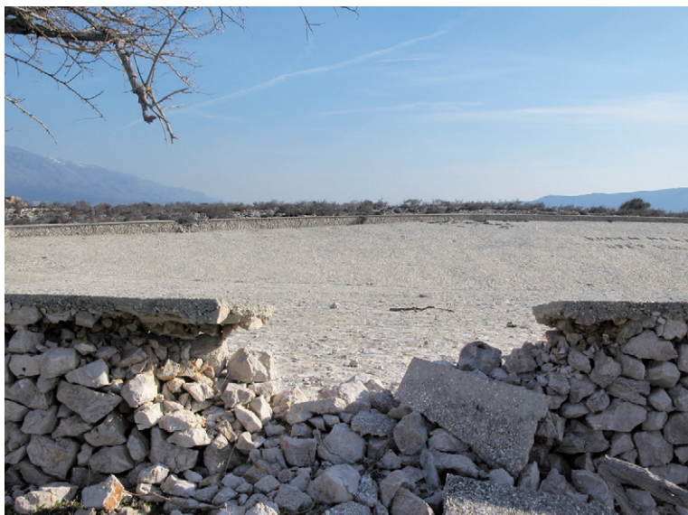
Spremnik za vodu

Osim što se logoraše ponekad i kažnjavalo manjim porcijama vode, vodu je logistički bilo teško dopremiti na Goli otok. U tu svrhu postojao je brod vodonosac "Izvor" koji je opskrbljivao logor vodom. Jedan od načina da se smišljeno doskoči problemu nedostatka vode na otoku bila je izgradnja velikog naplava gdje je prikupljana kišnica.