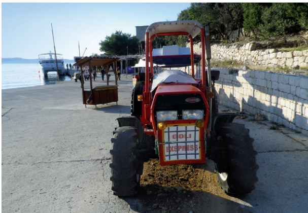
Pristanište na Golom otoku 2018.

Pozitivno je da se predstavnike vlasti ili barem njihove izaslanike s vijencima može vidjeti na obljetničkim komemoracijama na Golom otoku. Predstavnici političkih institucija Republike Hrvatske pohode Goli otok ponajčešće 23. kolovoza povodom Europskog dana sjećanja na žrtve svih totalitarnih i autoritarnih režima. No između slanja izaslanika s vijencem i izgradnje muzejsko-edukacijske infrastrukture s kvalificiranim osobljem i programima dug je put koji zahtijeva značajna ulaganja te spremnost različitih političkih i društvenih aktera da podrže taj proces.