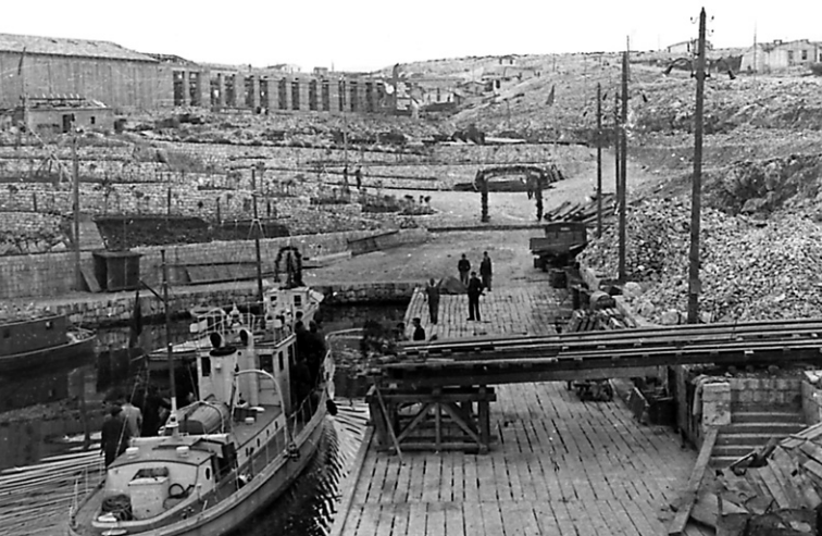
Pristanište na Golom otoku

„Pristanište“ je ostalo u lošem sjećanju logoraša jer je blizu njega počinjao špalir, dvored logoraša, koji je ponekad brojio i više od tisuću ljudi kroz koji su novopridošli logoraši prolazili i bivali tučeni. Zabilježeni se brojni smrtni slučajevi logoraša koji nisu izdržali špalir.