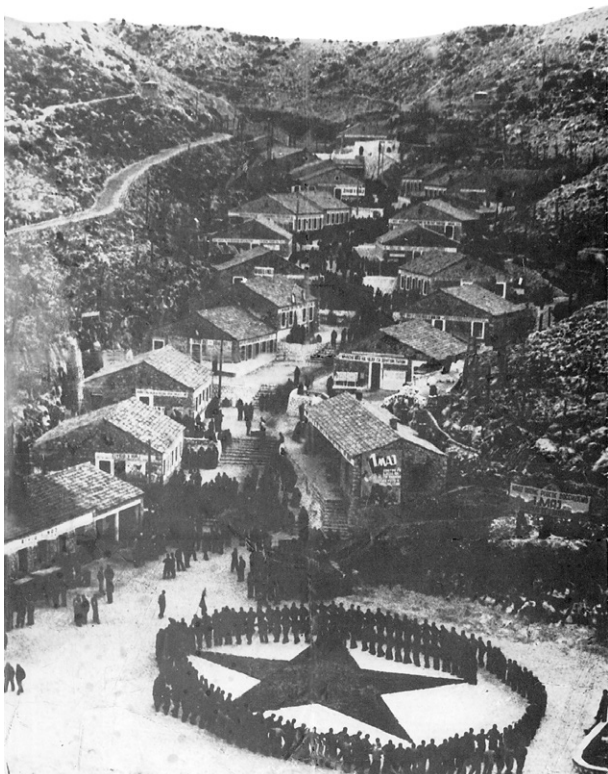
Logor „Velika žica“

Porastom broja uhapšenih ibeovaca povećao se i broj logoraša na Golom otoku. Time su smještajni kapaciteti u prvom logoru „Staroj žici“ postali nedostadni pa je uprava logora odlučila sagraditi drugi veći logor, poznat pod nazivom „Velika žica“ odnosno „Žica“. Logor je izgrađen 1950. godine i imao je više od 20 zidanih paviljona od kojih je svaki mogao primiti oko 250 kažnjnika. „Velika žica“ je bila okružena bodljikavom žicom sa stražaricama, a postojalo je i malo pristanište. Tu su također izgrađene zgrade za kulturnu sekciju, kuhinja, skladišta, sanitet, itd. Nakon zatvaranja logora upravo je „Žica“ rekonstruirana te je na ovom mjestu formiran zatvor KPD Goli otok. Originalne građevine vidljive na fotografiji su uništene. Današnji izgled lokaliteta u velikoj mjeri oslikava izgled zatvora iz kasnijih desetljeća.