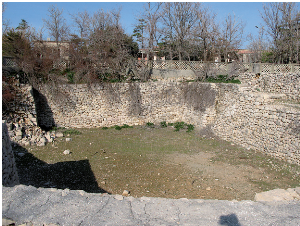
Ostaci logora "Petrova rupa"

Logor "Petrova rupa", alternativnih naziva „R-101“ i „Manastir“ sastojao se od jedne velike barake gdje je bilo internirano oko 130 osoba te manje zidane zgrade za logorsku kuhinju. Logor je izgrađen u jami dubine destak metara, kakvih je u svrhu potrage za boksitnom rudom u razdoblju između dva svjetska rata na Golom otoku iskopano nekoliko. Zatočenici su mahom bili tvrdokorni i beovci, stari komunisti, lideri Komunističke partije Jugoslavije prije dolaska Tita na vlast, osobe s dugim stažem u Sovjetskom Savezu, proslavljeni partizanski komandanti, itd. Svi oni zbog svog dugog partijskog staža bili su neskloni Titu i mahom su podržali Staljinovu stranu. Kako bi ih se izoliralo od ostalih logoraša, smješteni su na ovo usamljeno mjesto gdje su bili podvrgnuti jakoj torturi. Logor je nakon rasformiranja zatrpan. Fotografija prikazuje lokaciju na kojoj se najvjerojatnije nalazio logor „Petrova rupa“.